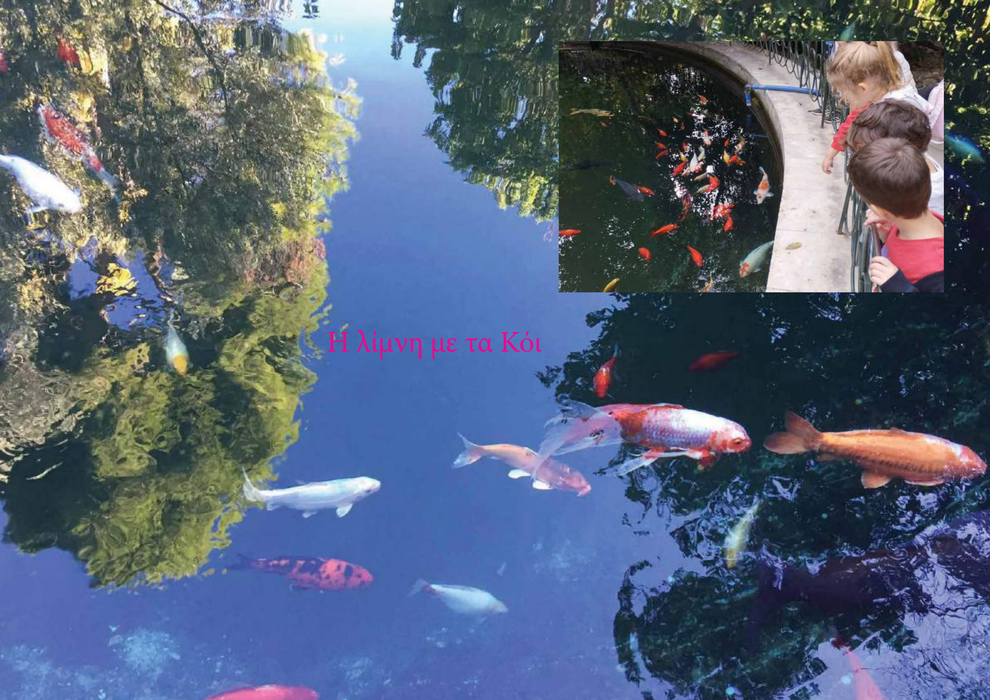
Η λίμνη με τα Κόι